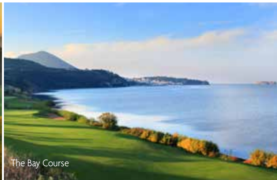
The Bay Course

Mit seinen beiden 18-Loch Golfplätzen hat sich Costa Navarino als einzigartiges Ganzjahresziel passionierter Golfer etablieren können. Selbst anspruchsvolle Golfer schätzen die Qualität der beiden Signature Golfplätze in Costa Navarino. Hinzu kommt, dass das Klima in Messenien ganzjährig mild ausfällt. Noch bis spät in den Herbst hinein liegen die Temperaturen in der Region bei über 20°C.