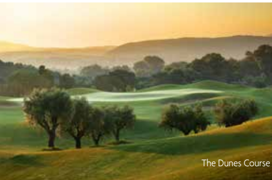
The Dunes Course