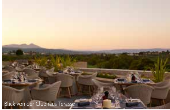
Blick von der Clubhaus Terrasse

zur Reise mit Peter Haworth: 5 Greenfees: 3x Bay Course, 2 x Dunes Course